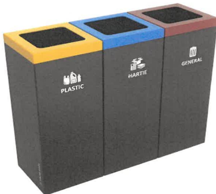
*Imagine cu titlu informativ