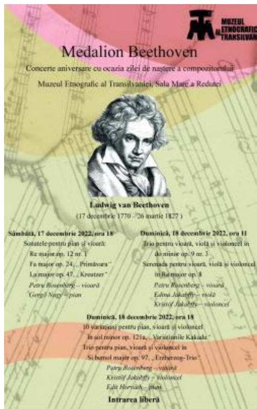
Imagini de la diverse evenimente (vernisaaje, lansări de carte, concerte, workshopuri, cursuri, ateliere)