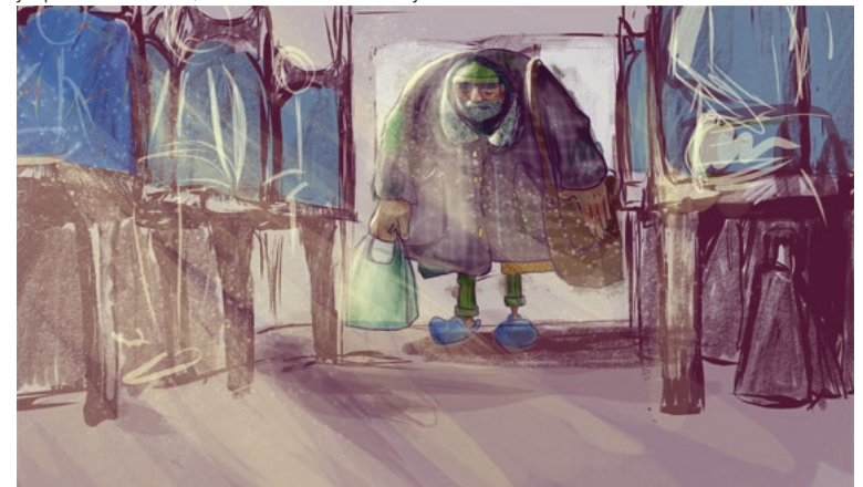
Слика 1: приказ сегмента сценарија једног од ранијих победничких радова

Стварање квалитетних радова од стране ученика и ученица морабити праћено њиховим промишљањем о савременим технологијама анимације. Лепота писане речи у томе је што није лимитирана и пружа могућност ономе ко пише да се у потпуности изрази користећи своју машту као извор креативности. Анимирање написане речи пружа пуно више могућности од филма да се визуализује замишљено, како оно што је реалистично, тако и оно што није.