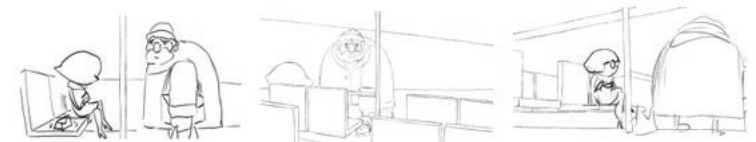
Слика 3: пример сториборда

Важан део будућег анимираниог филма јесте сториборд (енгл. storyboard), који представља серију цртежа са јасно представљеним појединачним кадровима филма (осмишљени планови, композиција, покрет камере, резови и сл.) и кратким описом онога што се у сваком од њих дешава. Сториборд стварају уметници/це који/е се професионално баве анимацијом и који/е су такође део тима укљученог у реализацију пројекта.