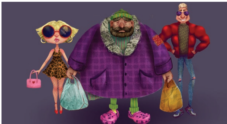
Слика 2: изглед карактера из једног од раније анимираних победничких радова

Како би сценарио, али и цео анимирани филм, био успешан, неопходна је детаљна разрада самих ликова, односно карактера. У визуелној уметности дизајн карактера је потпуно креирање естетике, личности, понашања и изгледа лика. Дизајнери карактера ће креирати ликове на основу ученичких описа из прича, при чему се сваки аспект карактера (облик, палета боја и детаљи) бирају из одређеног разлога.