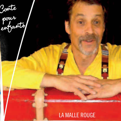
LA MALLE ROUGE