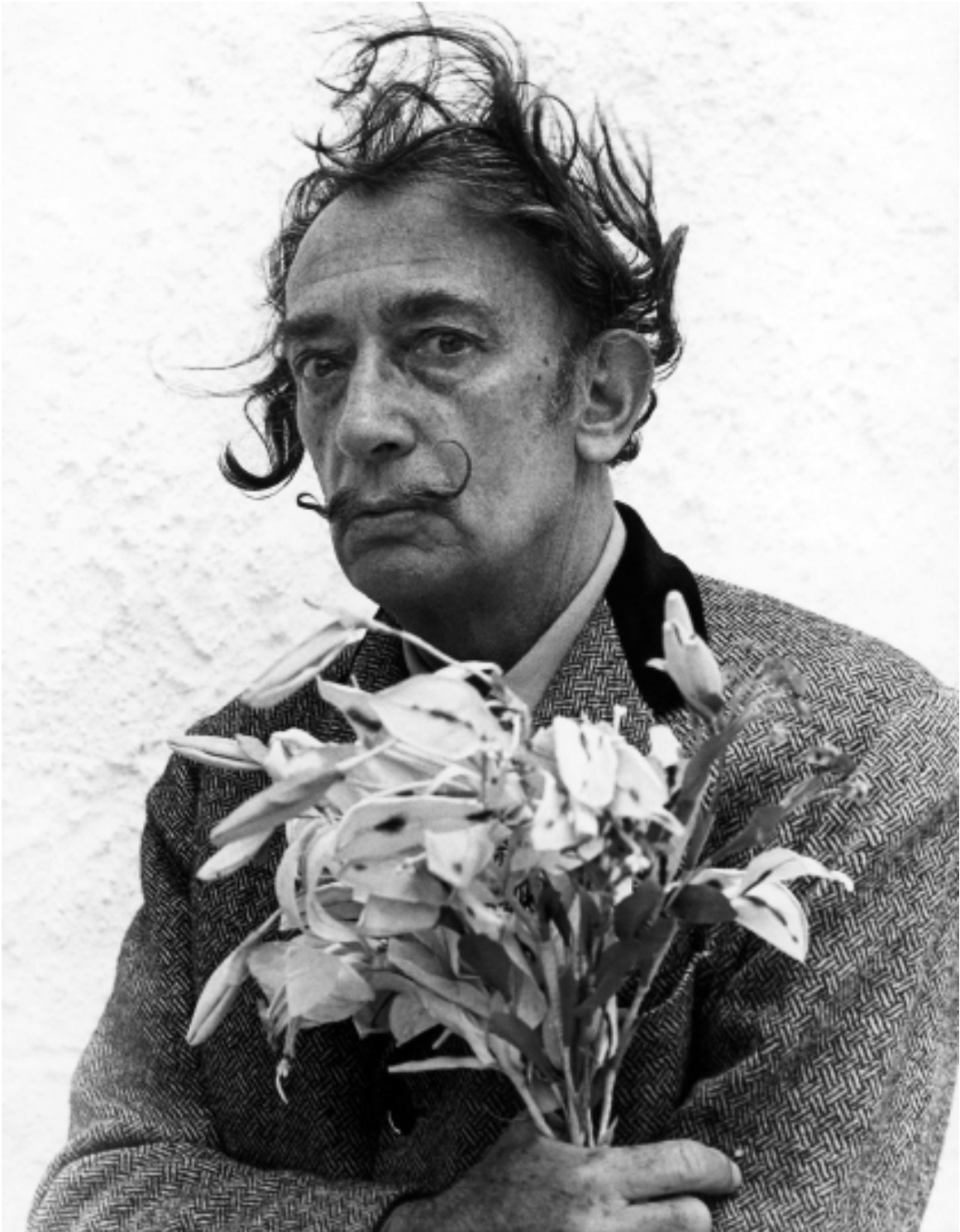
Pierre Boulat. Dalí avec un bouquet de fleurs , sans date.