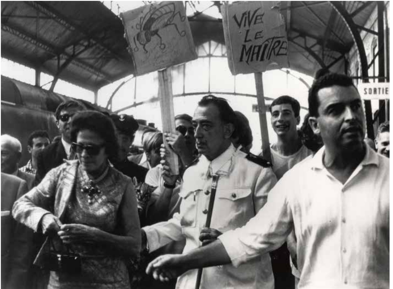
Jacques Barde. Dalí et Gala à la gare de Perpignan, 27 août 1965.