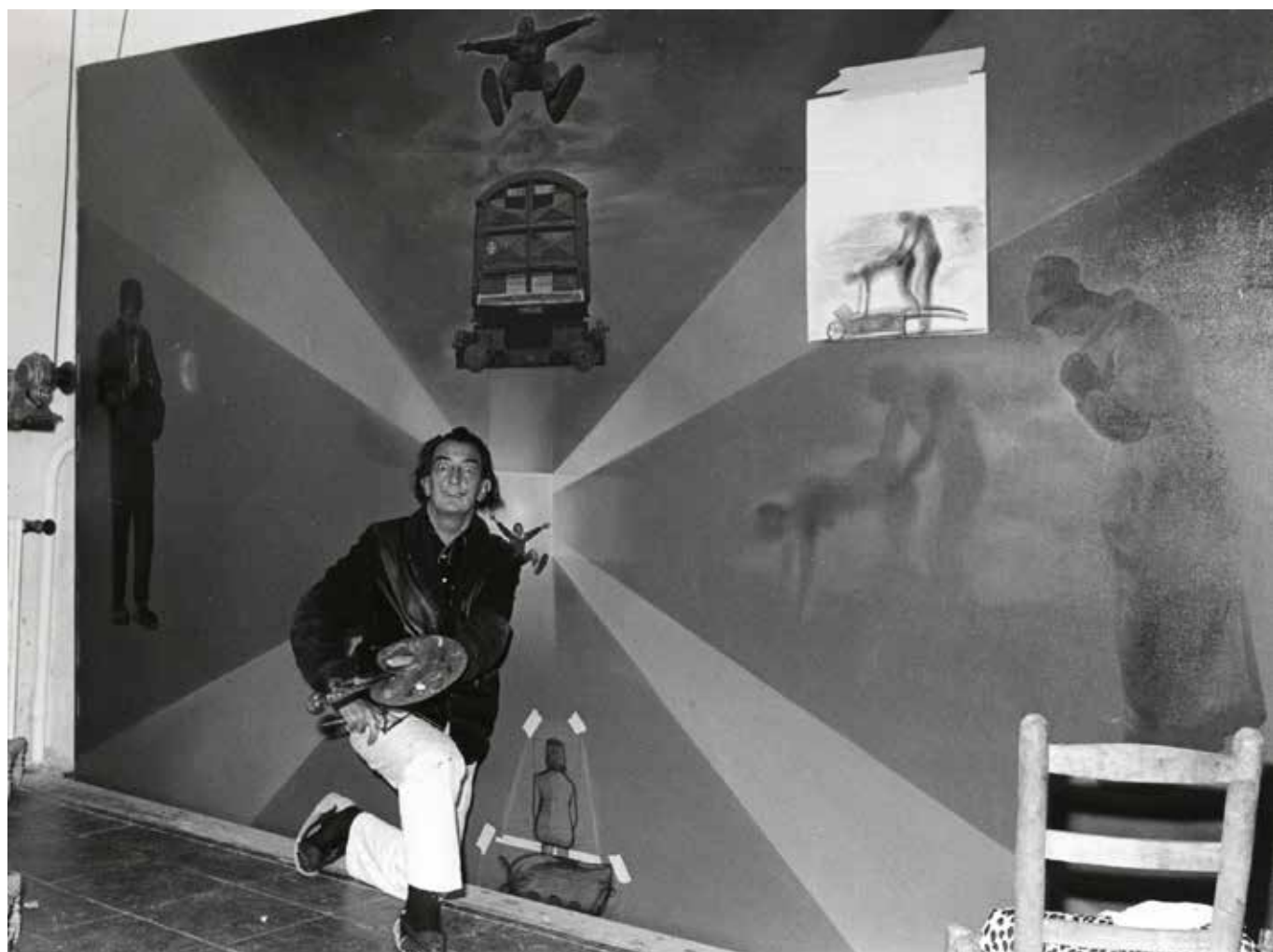
Jacques Barde. Dalí posant devant le tableau La gare de Perpignan , 1965.