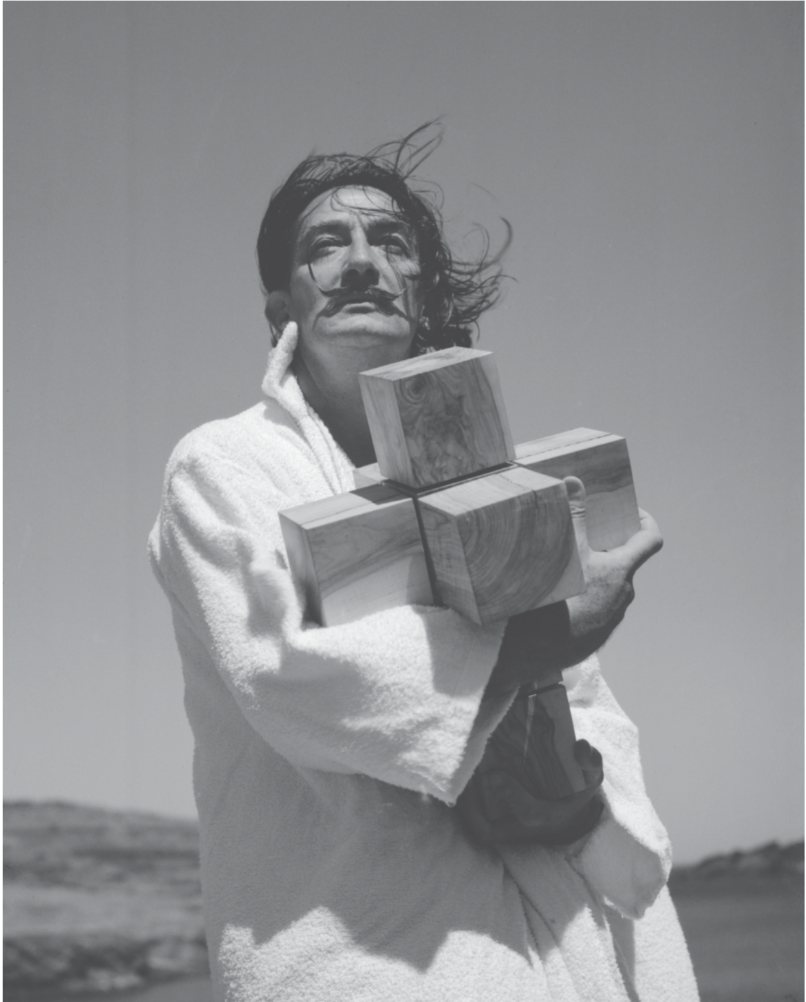
Dalí et la croix hypercubicus, Port-Lligat, sans date.