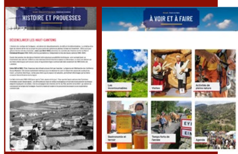
Carte interactive et rubriques pour les passionnés et les usagers pour découvrir le territoire des Pyrénées catalanes.

Les partenaires du site internet Parc naturel régional des Pyrénées catalanes Région Occitanie / Pyrénées-Méditerranée Conseil Départemental des Pyrénées-Orientales liO SNCF Etablissement Train Jaune Comité des usagers de la ligne du Train Jaune Communauté de communes Conflent-Canigó. Communauté de communes Pyrénées-catalanes Communauté de communes Pyrénées-Cerdagne Pierre Cazenove, historien Chemins de ligne du train Jaune Agence Canopée Chuck Productions JC Mihet