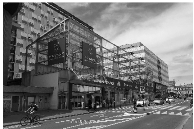
Ces images peuvent être soumises à des droits d'auteur.