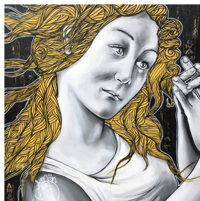
Différentes créations de la 2 e édition de L'Art Prend L'Air 2022.