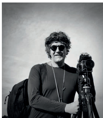
Portrait de Michael Kenna

Station Vél'Ô Toulouse : n°127 Begue-Demoiselles Bus Tisséo : ligne L9, Arrêt Demouilles (devant le musée) / ligne 44, Arrêt Place Henry Russell (500m) / ligne 27, Arrêt Trois Fours (500m) Métro : ligne B, station Saint-Michel-Marcel Langer (1km)