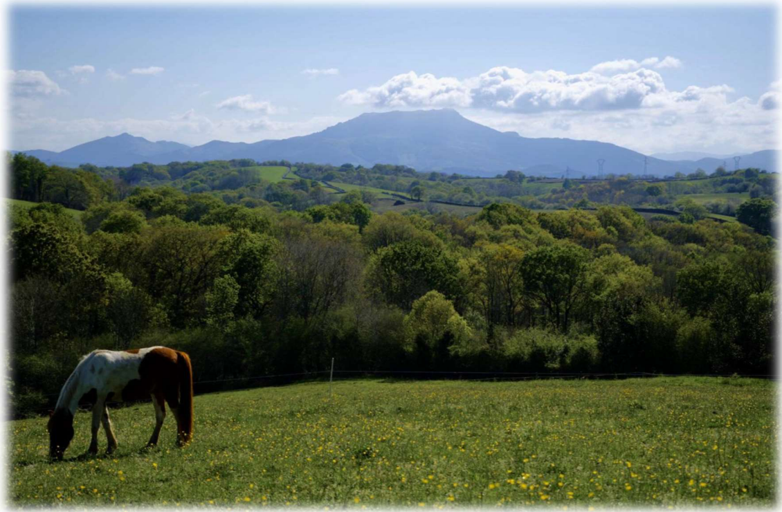
La vue sur les montagnes depuis les prés de Xuxurla. Un cadre qui invite à l'aventure...

Départ imminent pour les cavaliers de la ferme équestre Xuxurla le 15 mai 2023. Un an qu'ils attendent ce moment... La grande aventure s'apprête à commencer et tous ont du mal à le croire : ils débutent dans quelques jours la traversée des Pyrénées à cheval, d'Arcangues, dans les Pyrénées Atlantiques, jusqu'à Argelès sur mer dans les Pyrénées Orientales ! De l'océan Atlantique à la mer Méditerranée, le cortège Xuxurla s'apprête à parcourir 700 km à cheval. Une épopée d'un mois ponctuée de rencontres avec les acteurs locaux, mais aussi avec des cavaliers de chaque département se joignant à l'aventure le temps d'une ou plusieurs étapes.