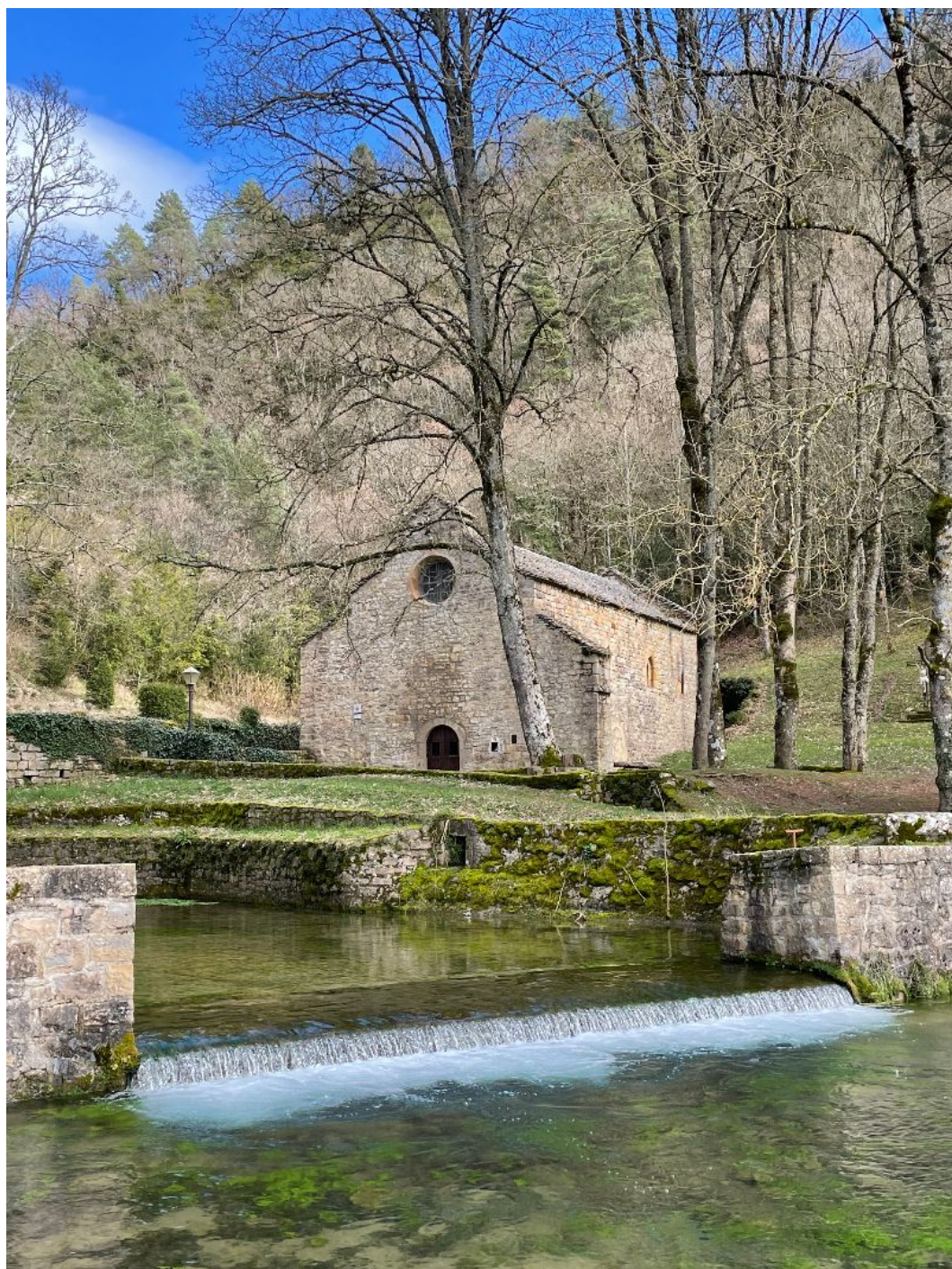
La chapelle Saint-Frézal de La Canourgue (Lozère)

09 63 57 44 06 occitaniemed@fondation-patrimoine.org