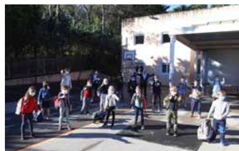
École primaire du Devens