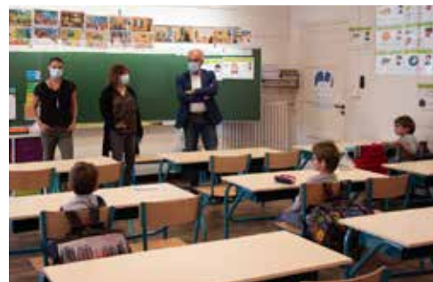
École primaire des Cabrières

140 enfants (CP et CM2) accueillis le 12 mai