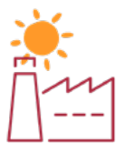
Colegas de trabalho

Veja com quais públicos você pode criar essa conexão: