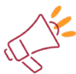
Pessoas da sua Religião