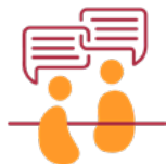
Pessoas do seu círculo de amizades