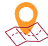
Pessoas e famílias da sua vizinhança