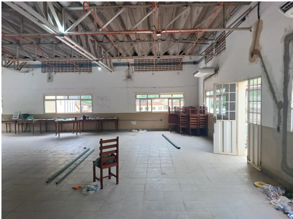
Figura 2- Local onde será executado o serviço de forro com placas de gesso acartonado.