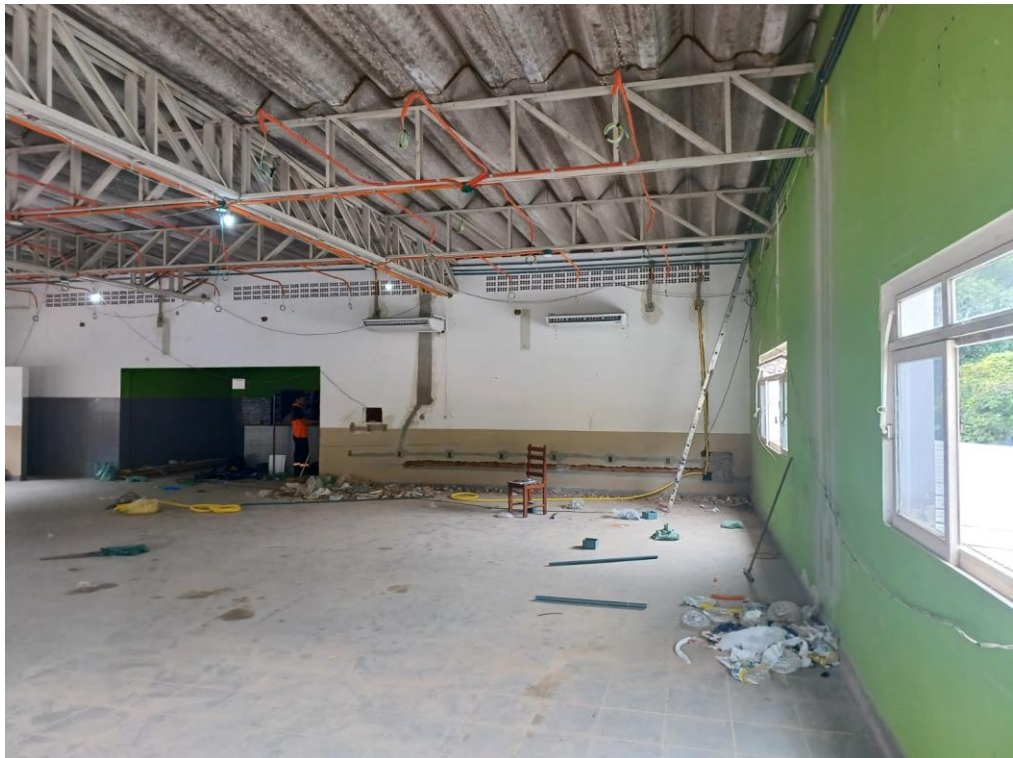
Figura 4- Local onde será executado o serviço de forro com placas de gesso acartonado.