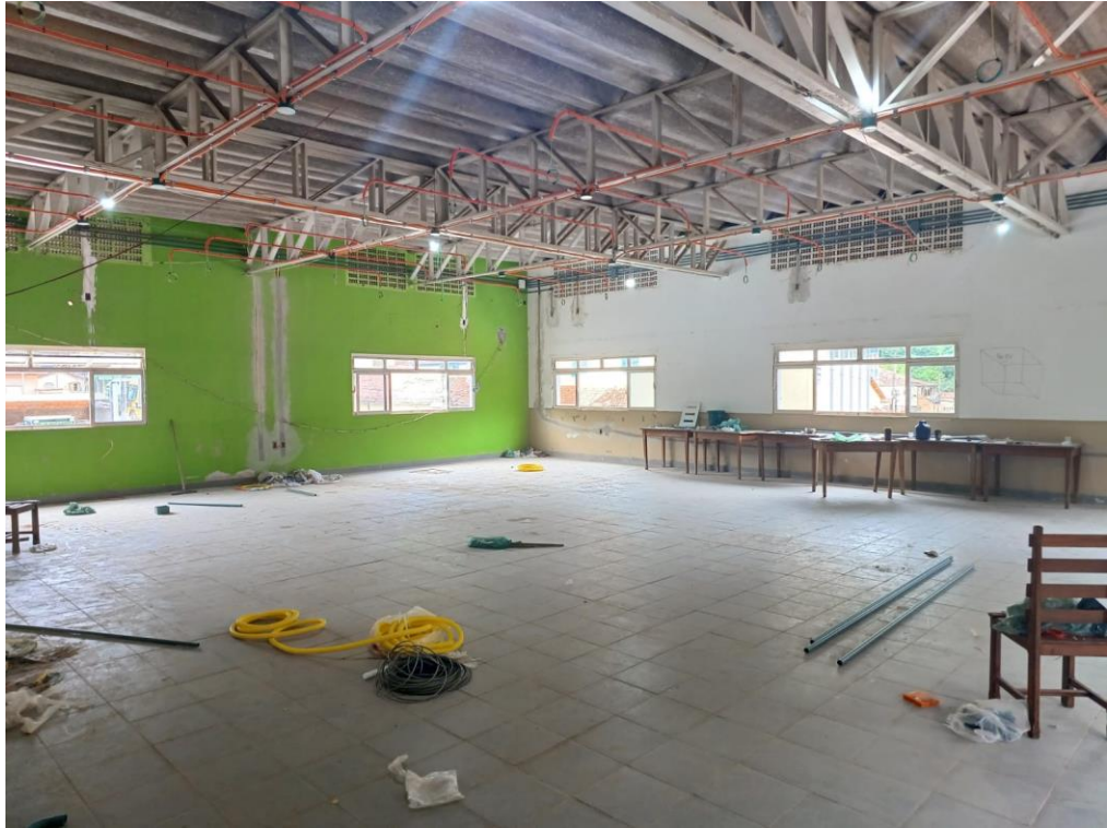
Figura 3- Local onde será executado o serviço de forro com placas de gesso acartonado.

Praça Nossa Senhora do Carmo, Nº 12, Centro, Carmésia/MG – CEP: 35.878-000