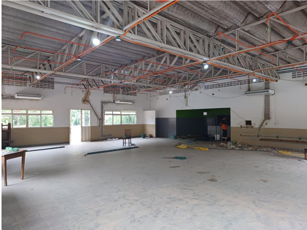
Figura 5- Local onde será executado o serviço de forro com placas de gesso acartonado.

Praça Nossa Senhora do Carmo, Nº 12, Centro, Carmésia/MG – CEP: 35.878-000