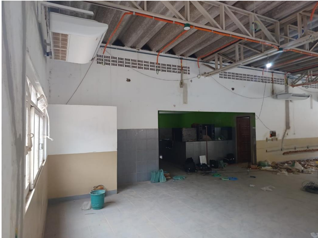
Figura 1- Local onde será executado o serviço de forro com placas de gesso acartonado.

Praça Nossa Senhora do Carmo, Nº 12, Centro, Carmésia/MG – CEP: 35.878-000