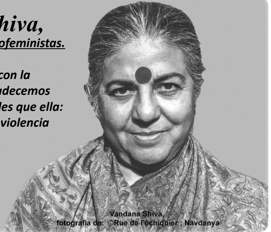
Vandana Shiva

P ara muchos expertos las únicas dos opciones que se abren ante la catástrofe ocasionada por la mano humana sobre la naturaleza son: la extinción de la vida como la conocemos o escapar (para quienes puedan que sin duda, no seríamos nosotras) hacia otro planeta habitable. Pero la apuesta ecofeminista grita: “ni escape ni extinción, sino protección”, por lo pronto esa es la contundente respuesta de la activista medioambiental anticolonialista más influyente de nuestra era.