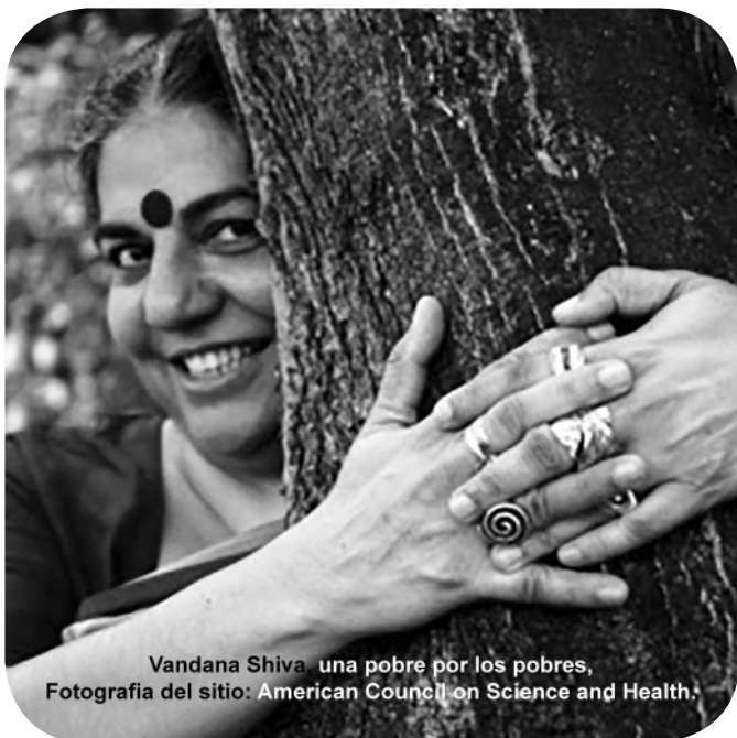
Vandana Shiva. una pobre por los pobres, Fotografía del sitio: American Council on Science and Health.

En Europa el 75% de los insectos han muerto debido al uso de químicos utilizados en la agroindustria.