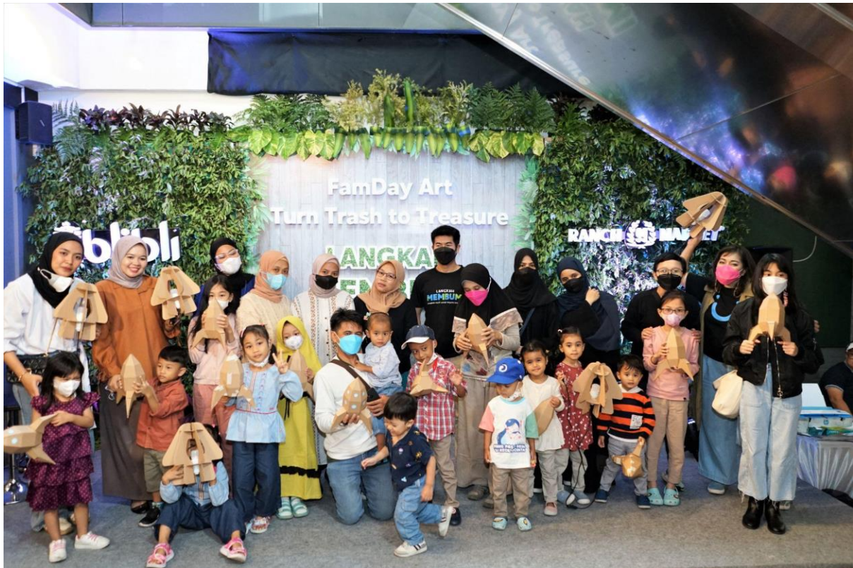
Kegiatan edutainment pentingnya mendaur ulang sampah bersama keluarga sebagai bagian dari Eksibisi Langkah Membumi

Eksibisi Langkah Membumi ini menjadi inisiatif berorientasi ESG (Environment, Society, Governance) pertama di bawah naungan ekosistem Blibli Tiket yang diharapkan dapat menjadi pemicu semangat masyarakat dalam mengambil langkah kecil yang konsisten dan berdampak positif bagi Bumi dan kualitas hidup yang lebih baik.