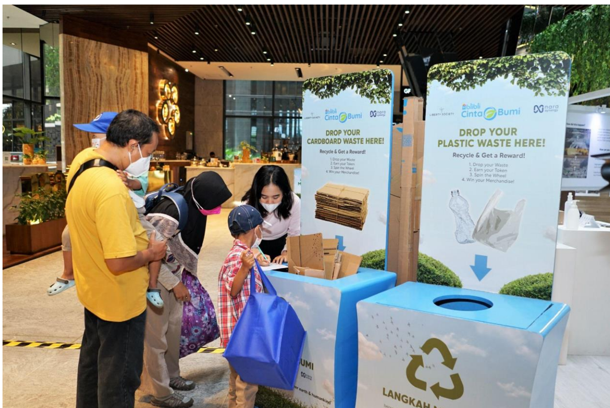
Orang tua mengajarkan anak pentingnya memilah sampah

Blibli juga mencatat kepedulian pengunjung, termasuk pekerja kantoran di kawasan SCBD yang peduli akan eco-conscious lifestyle, sesederhana berpartisipasi dengan mengembalikan kemasan bekas berupa kardus dan kemasan plastik.