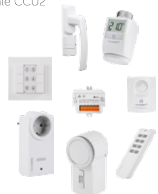
Homematic IP + Homematic Geräte