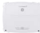
Multi IO Box