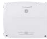
Multi IO Box