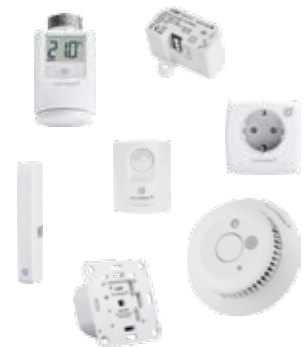
Homematic IP Geräte