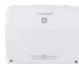
Multi IO Box