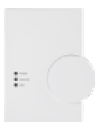
Zentrale CCU2 oder Zentralen von Partnern