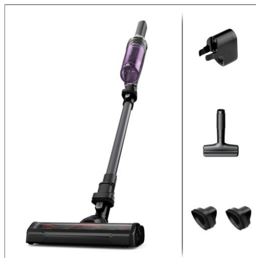
ROWENTA X-NANO mit 4 Zubehörteilen RH1128WO RH1128WO