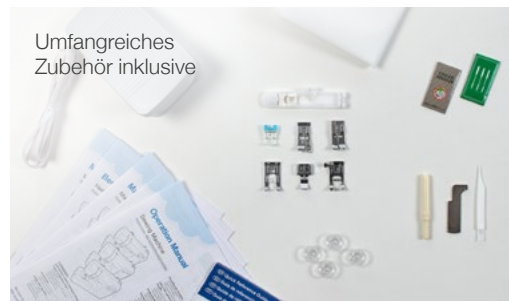
Umfangreiches Zubehör inklusive