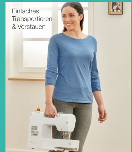
Einfaches Transportieren & Verstauen