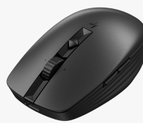
HP 710 Wiederaufladbare geräuschlose Maus 6E6F2AA