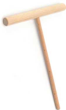
Répartiteur en bois