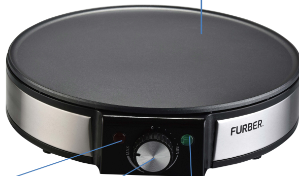
Plaque de cuisson