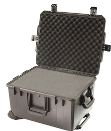
iM2750-X0001 With Foam