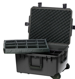
iM2750-X0002 With Padded Dividers