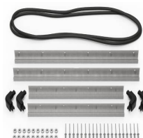
iM2750-M4-BEZEL Bodenlünette (metrisch)