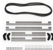
iM2750-M4-BEZEL-L Deckel-Lünette (metrisch)