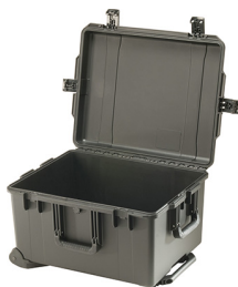
iM2750-X0000 No Foam