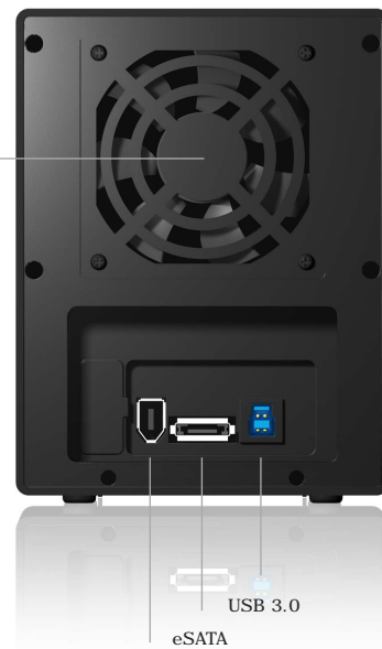
eSATA USB 3.0 FireWire 400 und 2x FireWire 800 auf der Gehäuse-Seite

Temperatur gesteuerter Smart Lüfter, 80x80x20 mm