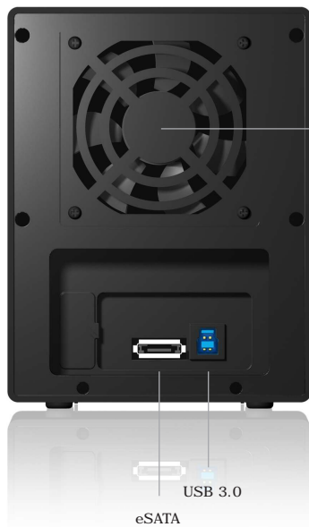
eSATA USB 3.0