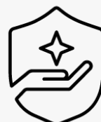
3 Jahre Abhol- und Lieferservice UM946E