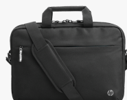
Sacoche pour ordinateur portable HP Professional 14,1 pouces 500S8AA