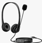
Casque stéréo USB HP G2 428H5AA