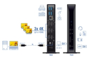
Maximum resolution (depending on the system and the connected hardware)