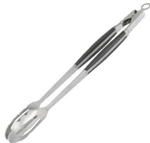
Premium Grillzange (2000014567)