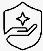
3 Jahre Abhol- und Lieferservice UM917E