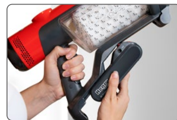
Semplice sostituzione della batteria

La staffa a parete con porta accessori integrato, permette di riporre facilmente Henry Quick e di ricaricarlo allo stesso tempo.