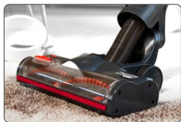
Turbo spazzola elettrica

Massima performance per ottenere i migliori risultati di pulizia su pavimenti duri e moquette.