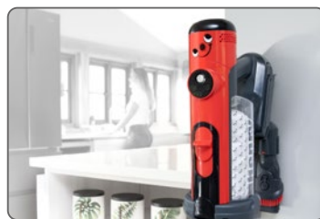
Pratico stazionamento a parete

Bocchetta per interstizi e accessorio combinato 2 in 1 per una pulizia accurata di altissimo livello.