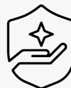
3 Jahre Abhol- und Lieferservice UM946E