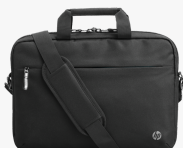
HP Professional 14,1 Zoll Laptop-Tasche 500S8AA