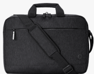
HP Prelude Pro 17,3 Zoll Laptop-Tasche 3E2P1AA