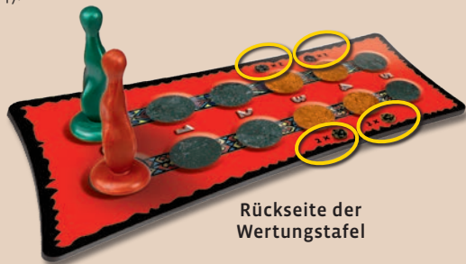
Rückseite der Wertungstafel

Legt die Wertungstafel mit der Rückseite in die Tischmitte ( mit Würfelsymbolen auf den Feldern 3 und 4).