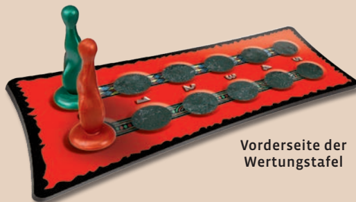
Vorderseite der Wertungstafel