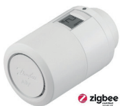
Danfoss Ally™ Heizkörperthermostat