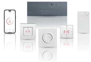
Danfoss Icon2™ System