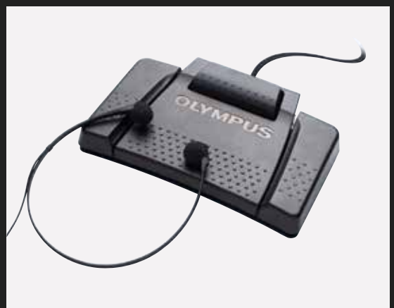
AS-9000 beinhaltet RS-31H, E-102, ODMS Transkriptions-Modul (Einzel Lizenz)

Das ODMS Transkriptions-Modul bietet eine nahtlose Schnittstelle zur Dragon NaturallySpeaking* Software. Durch den Einsatz der Spracherkennung wird die erforderliche Zeit für die Transkription Ihrer Diktate wesentlich verringert.