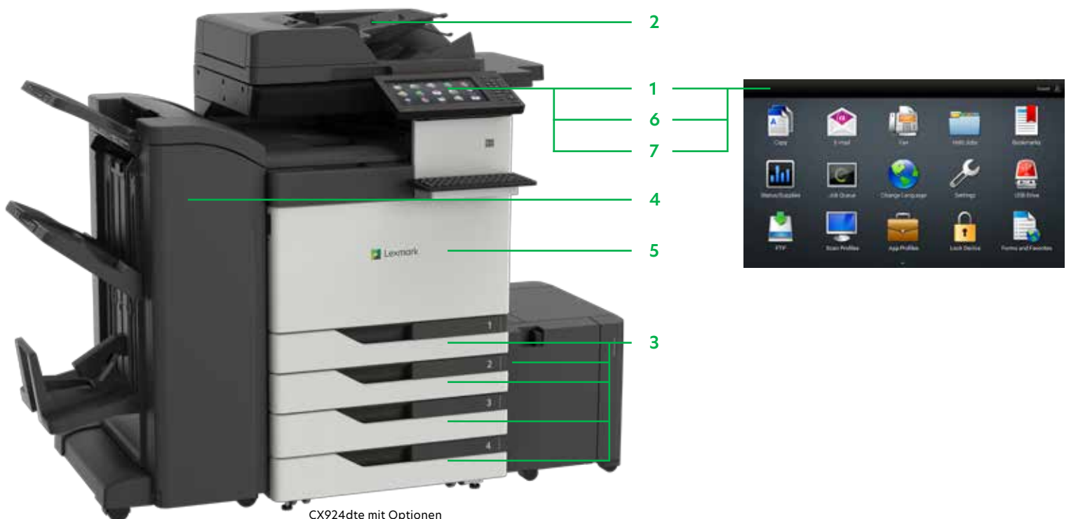
CX924dte mit Optionen

Drucken Sie Microsoft Office-Dateien, PDFs und andere Dokument- und Bildarten von Flash-Laufwerken oder wählen Sie Dokumente auf Netzwerk-Servern oder Online-Laufwerken aus und drucken Sie sie.