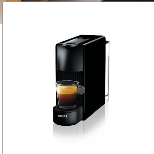
Nespresso Essenza Mini Essenza Mini Piano Schwarz XN1108CH