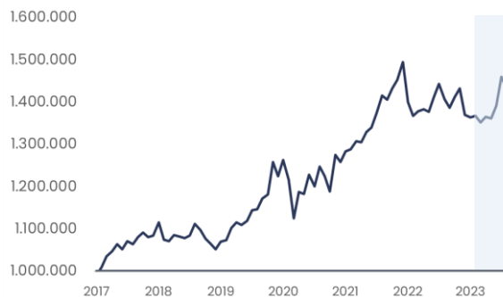
Rentabilidad desde inclusión de Activos Alternativos

Si hubieras invertido $1.000.000 en este portafolio hace 12 meses, tu resultado sería $1.019.024 (1)