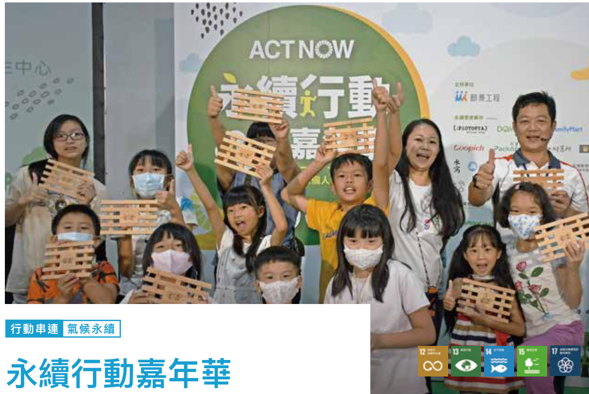
行動串連 氣候永續