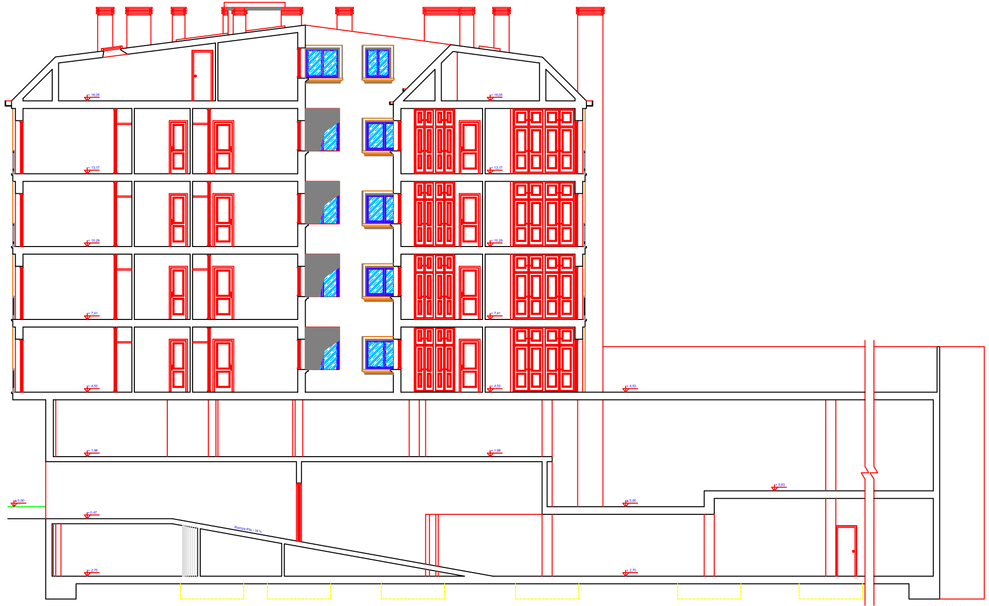
SECCION B-B Escala: 1/50