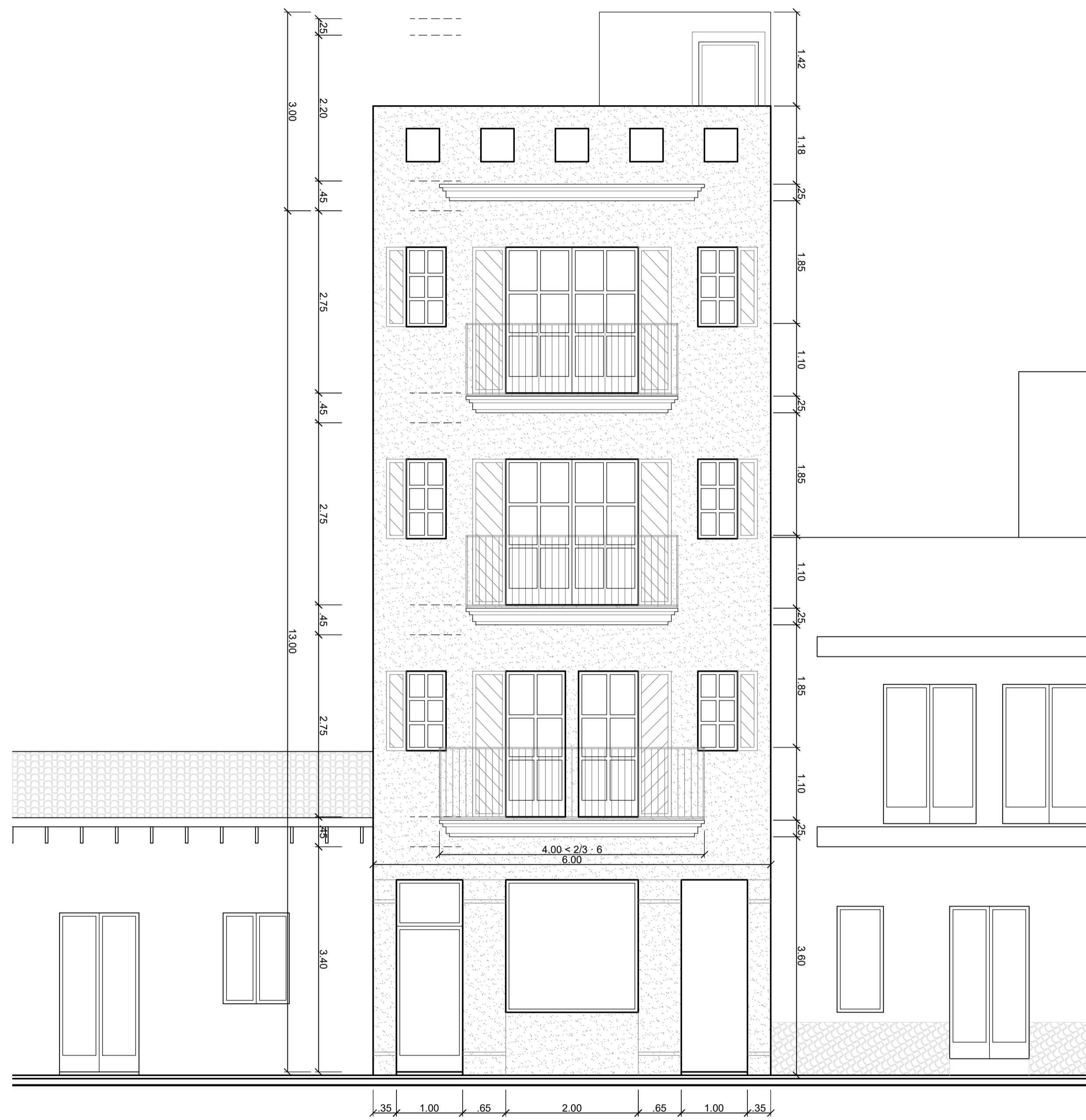
ALZADO PRINCIPAL - E:1/50