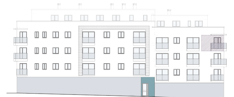
ALZADO D - AVENIDA PRÍNCIPE DE ASTURIAS