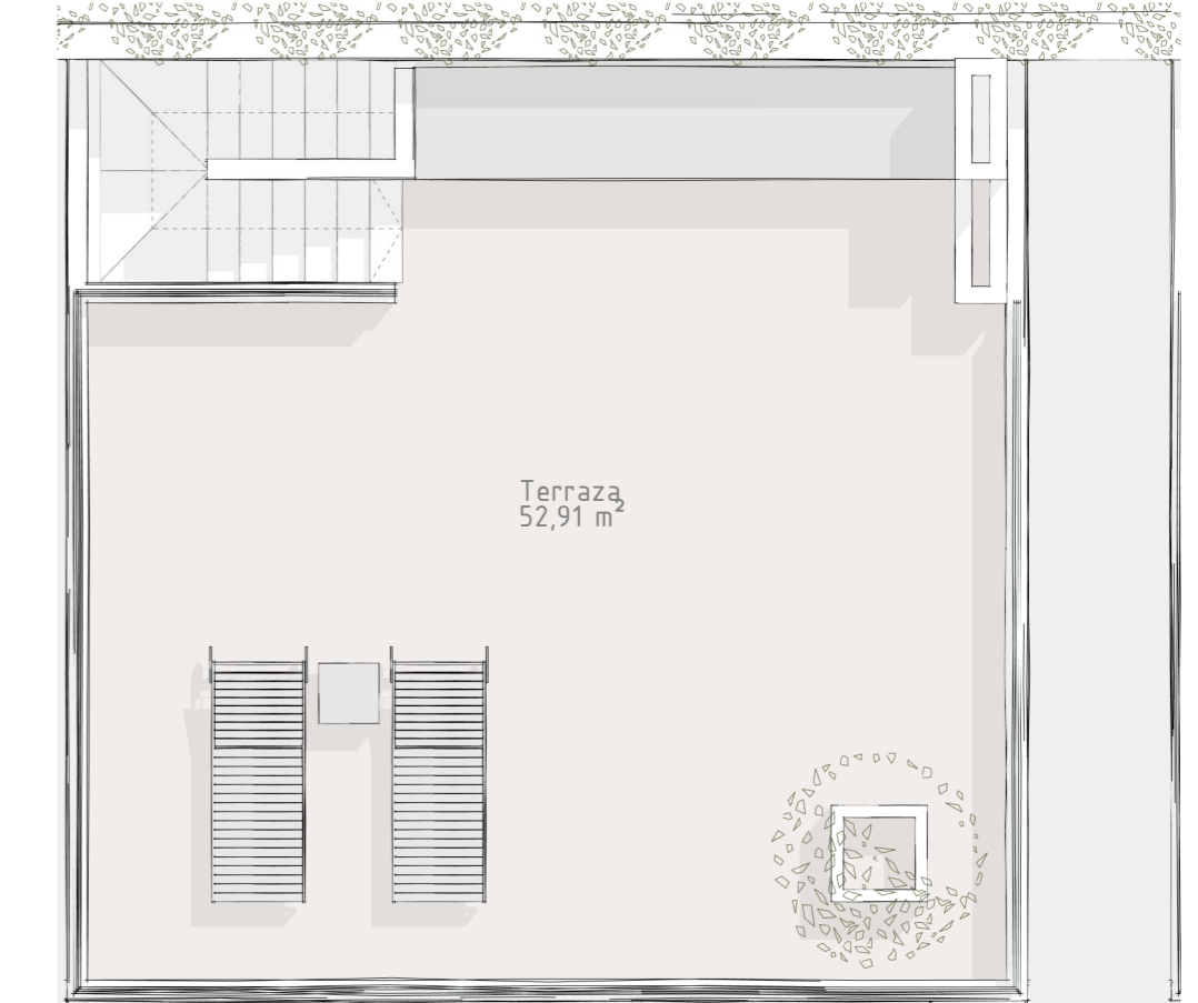
2.Viv. Unifamiliar. Terraza