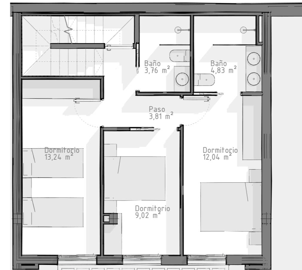
2.Viv. Unifamiliar. Planta 1ª