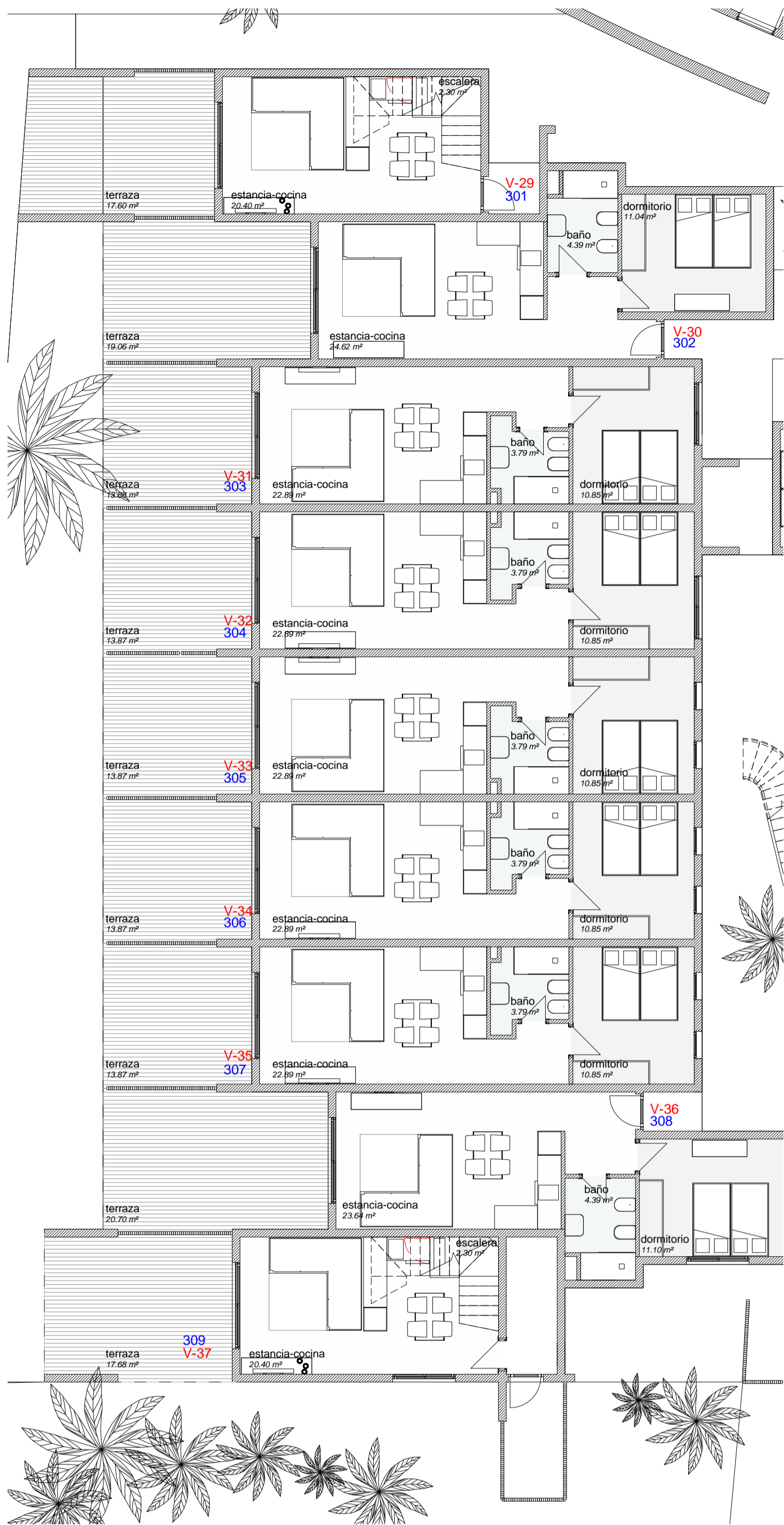
1 - P baja - sup REFORMADO - BLOQUE 3 1 : 100