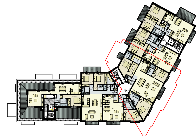
Positie in bouwblok, schaal 1/500