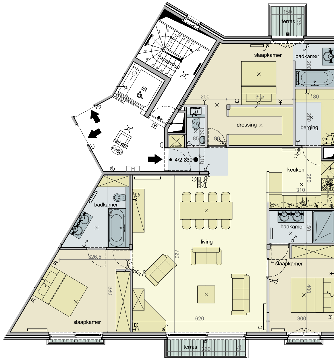
3e verdieping appartement 4/2 0301, schaal 1/100