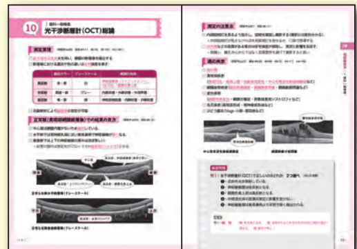
項目の最後には問題演習。知識の定着をすぐに確認できる！