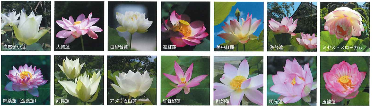
白君子小蓮 大賀蓮 白碧台蓮 蜀紅蓮 美中紅蓮 浄台蓮 ミセス・スローカム 錦葵蓮 (金葵蓮) 剣舞蓮 アメリカ白蓮 紅舞妃蓮 醉妃蓮 明光蓮 玉繡蓮