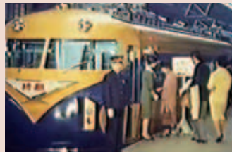
名阪特急に使われたピスタカー(10100系)の映像(「伸びゆく近鉄」より)