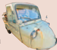
ダイハツミゼット (伊勢のりもの博物館所蔵)