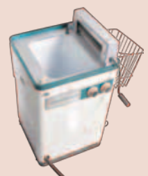
当時普及した電気洗濯機(当館所蔵)

当時活躍した三重県出身の建築家東畑謙三や、なつかしの建物、環境に関する展示、当館が収集した県内各地の風景写真も紹介。