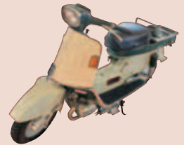
ホンダジュノオ (Honda Cars 津所蔵)