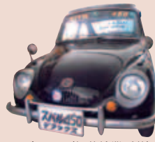
スバル450(加藤輪業所蔵) スバル360の上位機種で、世界でも数少ない保存車体