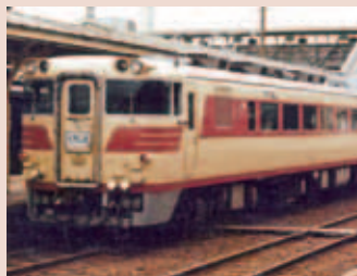
国鉄の特急くろしお号