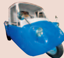
マツダK360 (伊勢のりもの博物館所蔵)