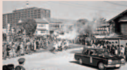
三重県庁を出発したオリンピック聖火リレーの写真