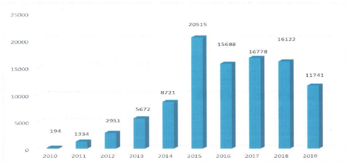
Obrázok 1 Prehľad počtu vydaných osvedčení zaevidovaných v ISDV

Obrázok 1 Prehľad počtu vydaných osvedčení zaevidovaných v ISDV k 1.12.2019