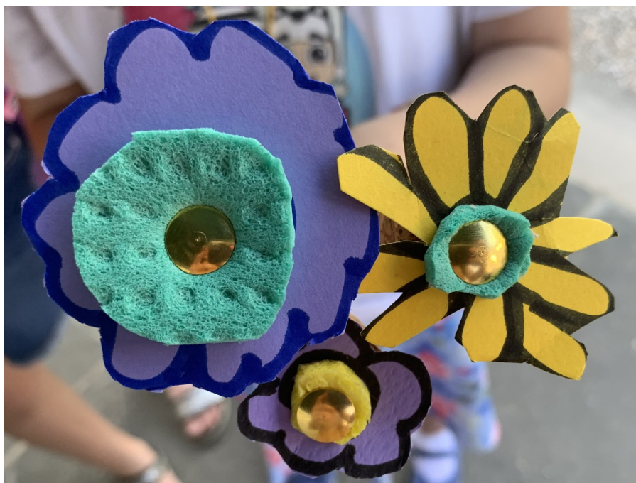
IMMAGINE 4: Fiori realizzati in carta e spugna dai bambini al laboratorio coordinato da ARPAT, dove poter mettere acqua e zucchero e "piantarli" nei vasi dei propri giardini e/o balconi per attirare le api.