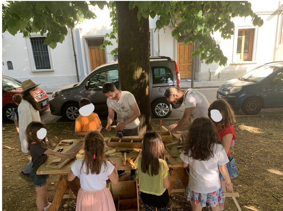
IMMAGINE 6: Bambini al laboratorio “La bottega di Geppetto”.