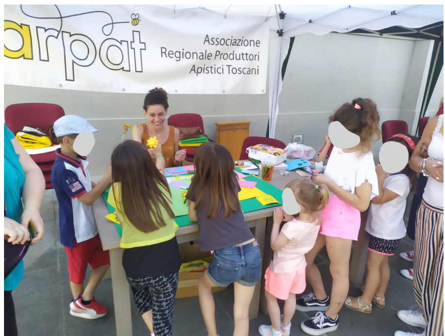
IMMAGINE 2: Gazebo ARPAT, postazione laboratorio "La casa di vetro delle api: osserviamole e regaliamogli un fiore".