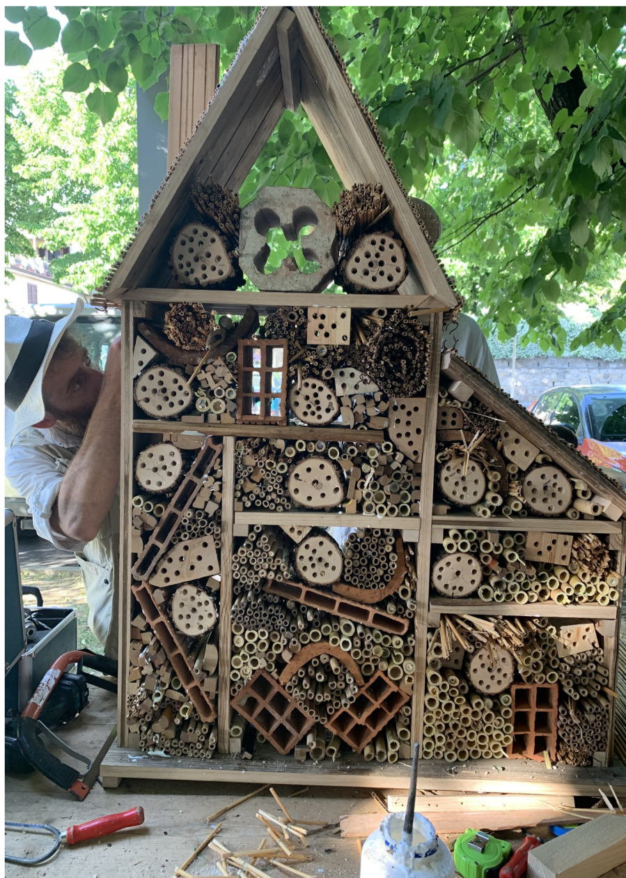
IMMAGINE 7: Bee Hotel realizzato collettivamente dai partecipanti alla Festa delle Api e della Biodiversità – 21 maggio 2022 con l'Associazione Fantulin.