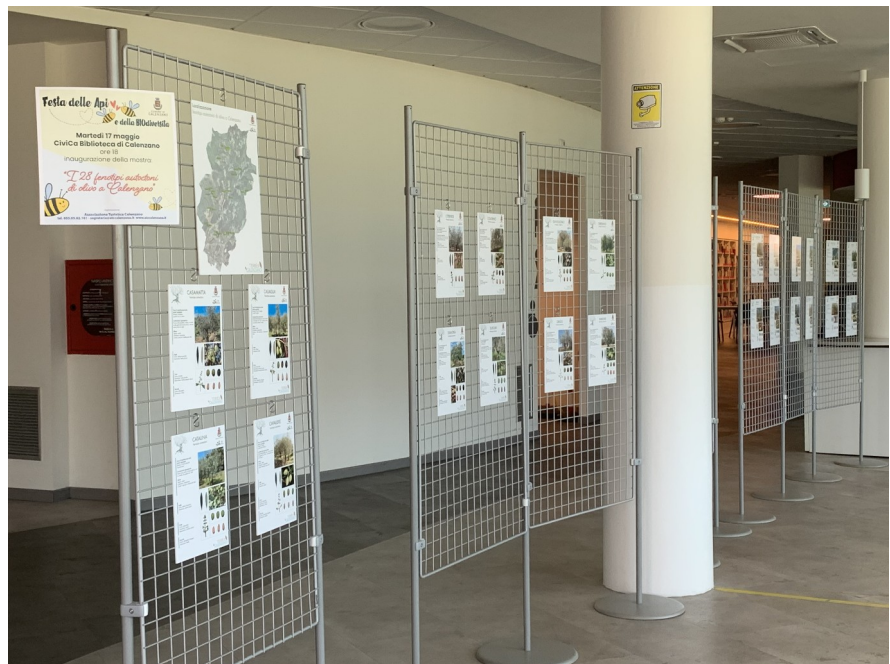
IMMAGINE 1: Mostra 28 fenotipi di olive autoctone a Calenzano