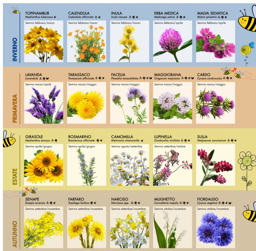
IMMAGINE 8: Calendario Semine Bee Friendly consegnato ai partecipanti alla Festa delle Api e alle scuole dell'infanzia e primaria che hanno partecipato ad un progetto di educazione ambientale sulle api nell'A.S. 2021/2022.