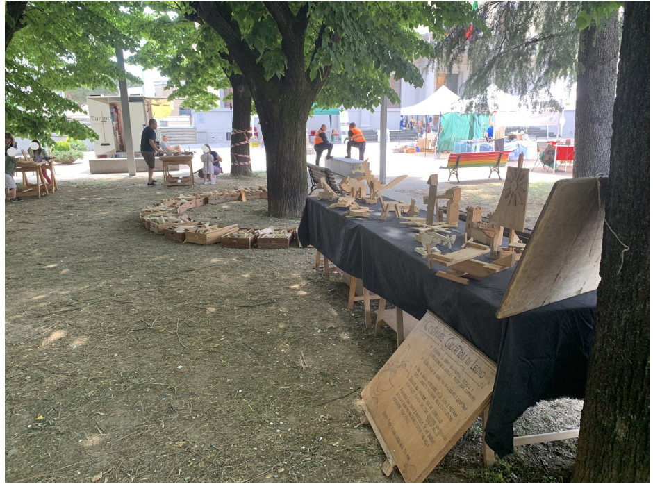
IMMAGINE 5: Laboratorio “La bottega di Geppetto” per la costruzione di sculture in legno di recupero e “La casetta degli insetti” per la costruzione collettiva del bee hotel a cura dell’Associazione Fantulin.