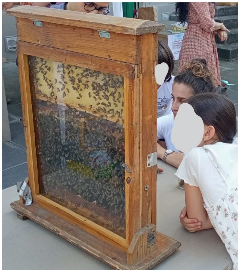
IMMAGINE 3: Arnia didattica – ARPAT con osservazione della casa di vetro delle api e curiosità su questi impollinatori importantissimi per l'ambiente e la nostra vita.