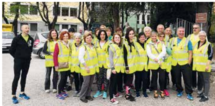
IL GRUPPO DI CAMMINO LONATESE

L'attività motoria regolare è un fattore di prevenzione per tutti, sottolinea l'assessore allo Sport Roberto Vanaria. «È dimostrato che riduce l'incidenza di malattie croniche, disturbi motori e incidenti domestici, camminare crea benessere psicofisico e favorisce la socialità. Muoversi fa bene sia al corpo che alla mente – conclude l'assessore – e, se la pratica è regolare,