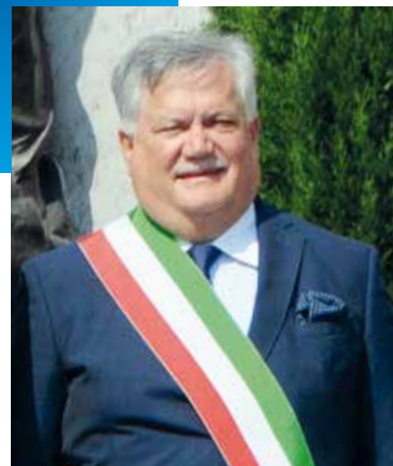
ROBERTO TARDANI Sindaco

Ovviamente i Comuni... Il numero degli assistenti ad personam pagati dai Comuni presso gli Istituti scolastici del territorio, dalle scuole dell'infanzia alle secondarie superiori, cresce di anno in anno, e con esso i costi relativi. Oltre 440 mila Euro, nel 2019. Quest'anno, finalmente, la possibilità di incrementare le aliquote fiscali è stata ripristinata e anche Lonato è costretto farvi ricorso. La decisione presa è quella di incrementare le aliquote dell'addizionale comunale Irpef, riportandole allo 0,5 per cento, aliquota in vigore fino al 2009. Anche dopo questo incremento ci troviamo ad un livello di tassazione ben al di sotto di quello imposto da altri comuni sia della nostra stessa