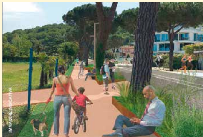
FOTO SIMULAZIONI DELL'OPERA DI RIFACIMENTO DEL LIDO DI LONATO