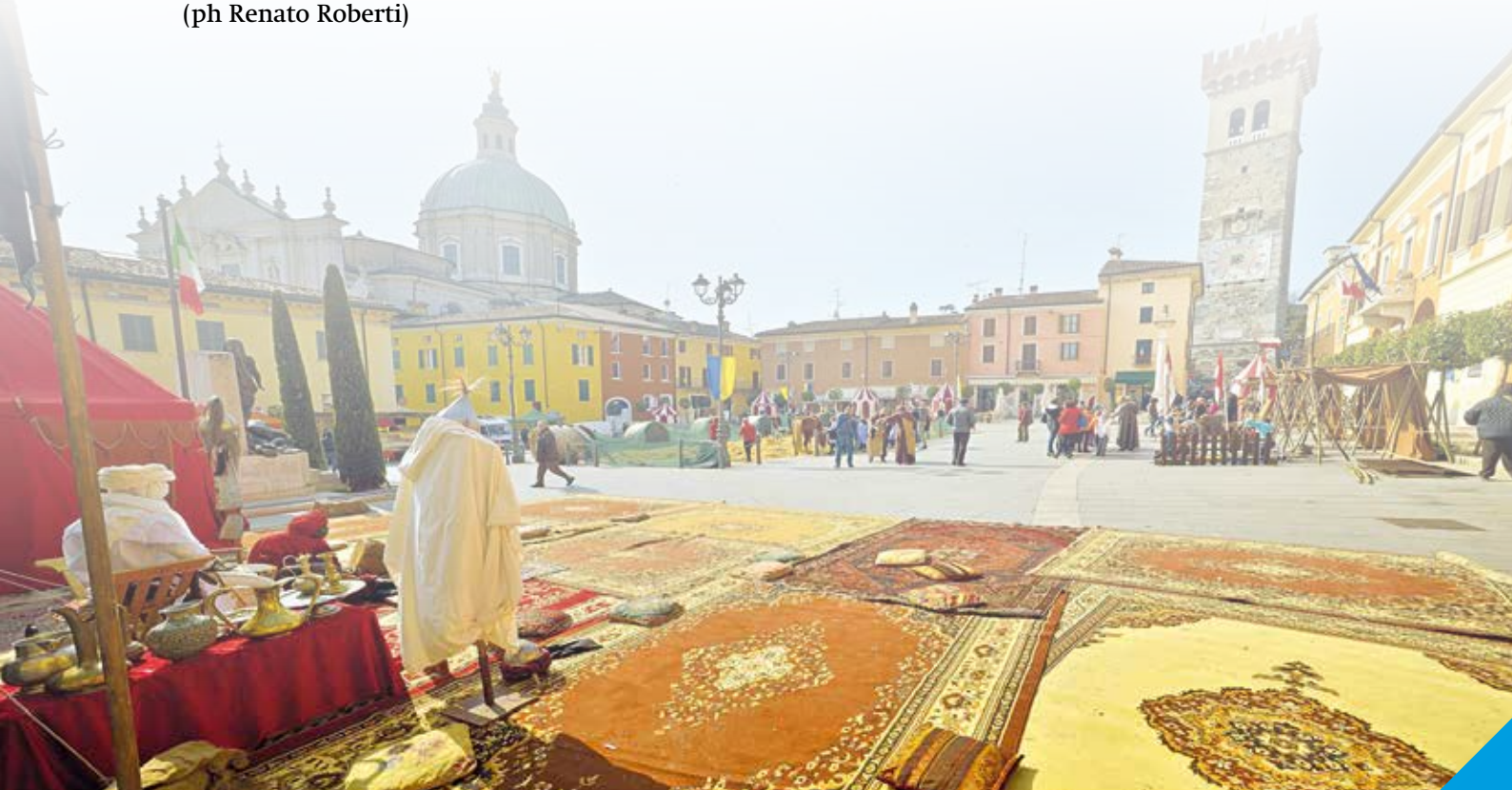
CITTADELLA IN FESTA

Centinaia i visitatori che hanno scoperto i tesori d'arte e storia del centro storico di Lonato del Garda: la Torre Civica aperta per l'occasione dai volontari dell'Associazione La Polada, la Rocca visconteo veneta con il Museo Civico Ornitologico e la Casa del Podestà aperte grazie al sodalizio dell'Associazione Amici della Fondazione Ugo Da Como.